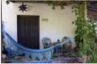
Terrazas y hamacas