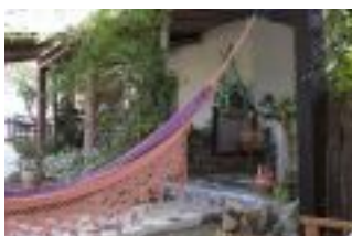
Terrazas y hamacas

Para Uso Común dispone de una amplia cocina con todo lo necesario para su uso habitual, y a ella se une un horno de leña y una barbacoa .