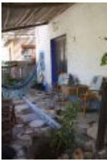
Terrazas y hamacas