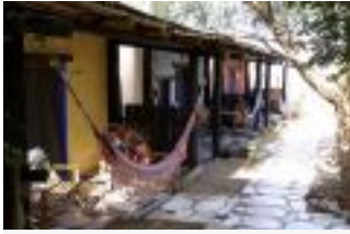
Terrazas y hamacas

Viernes, 01 de Junio de 2018 09:01 - Last Updated Viernes, 01 de Junio de 2018 09:10