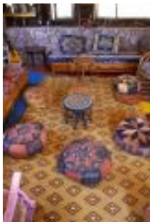
Salón Comun y eventos

USO DE LA COCINA COMÚN : En la cocina al ser compartida hay unas normas para la fluida convivencia: