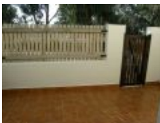
Entrada y terraza